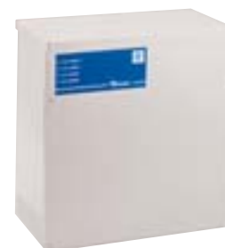
Coffret IP 30