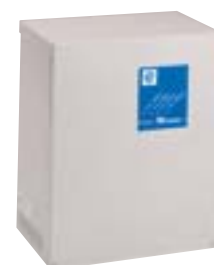
Coffret IP 31