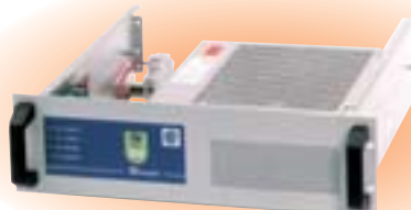
IP30 (module intégré dans la baie)

Le système de maintien du rack sur la baie 19" facilite la mise en service et la maintenance