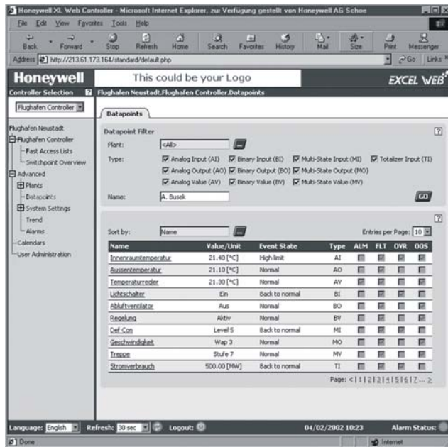
Fig. 1. Exemple de page d'accueil Excel Web®

En dehors du système d'exploitation et d'Internet Explorer® ou Netscape®, aucun logiciel n'est nécessaire sur les PC client.